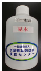
一般用 1000ml ポリビン