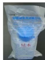
細菌用 200ml ポリビン (試薬入り)